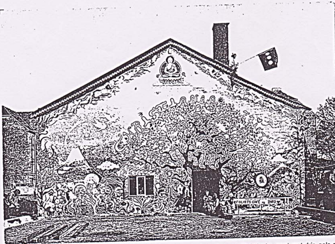
Op het dak van het fantasievol beschilderde Info Café toont iemand de vlag van Christiania: rood met drie gele stippen.

Voor hen golden nog steeds de eerste regels van het 'volkslied' van Christiania: "Christiania, du har mit hjerte (Christiania, jij hebt mijn hart her vil jeg bo hier wil ik wonen her kan jeg leve hier kan ik leven for i hele verden want in de hele wereld fandt jeg vond ik aldrig den frihed nooit de vrijheid du har givet her..." die jij hier geeft...)