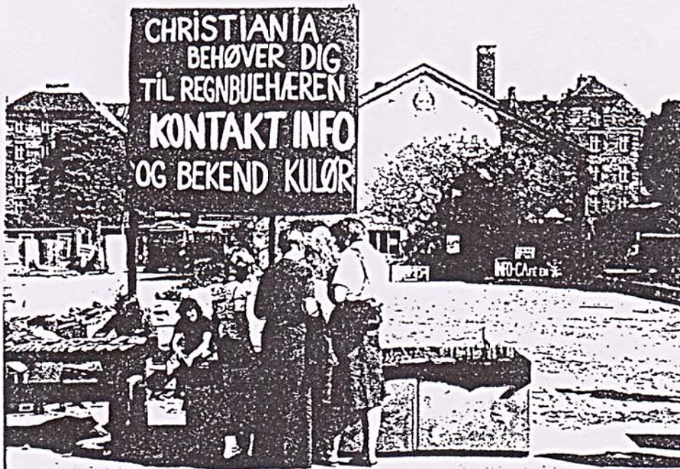
Het voorplein van Christiania, waar ondermeer geworven werd voor het 'Regenboogleger' en waarvoor men zich in het 'Info Café' op de achtergrond kon aanmelden.

Christiania droeg er toe bij dat de regering niet tot ontruiming durfde over te gaan. Dat leidde weer tot nieuwe debatten in het Folketing, met als gevolg dat de ontruiming voor onbepaalde tijd werd uitgesteld. En van uitstel kwam afstel.